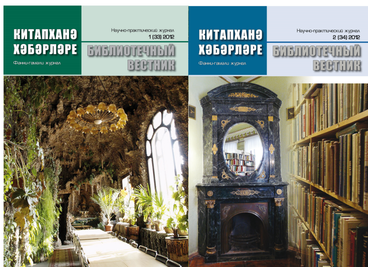
Выпуски научно-практического журнала «Библиотечный вестник»