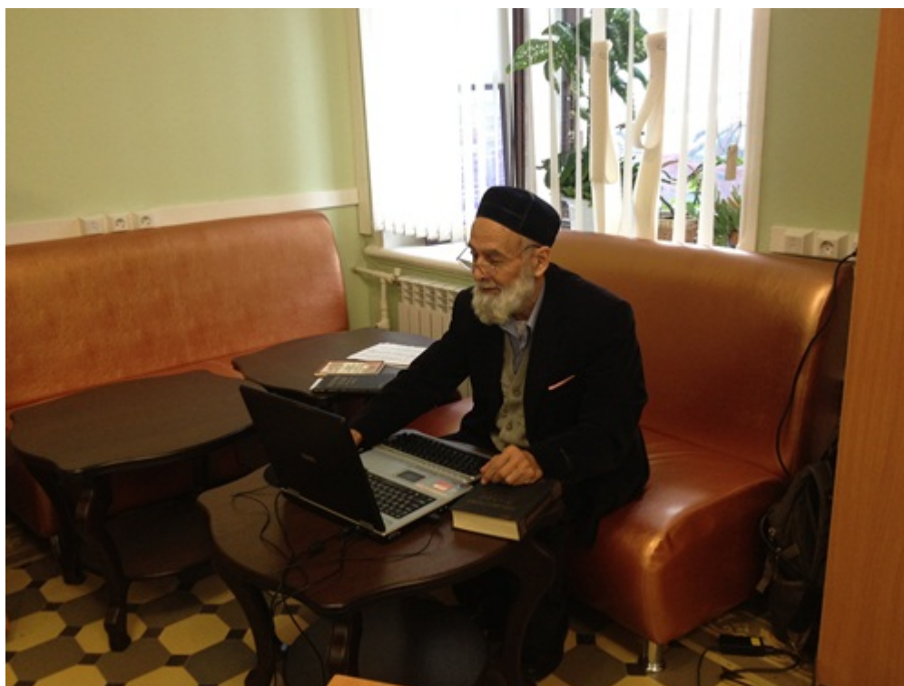
В зоне Wi-Fi

В течение 2012 г. были приняты новые решения в целях модернизации и повышения качества библиотечных услуг – появились зоны Wi-Fi. Многие пользователи уже оценили преимущества беспроводной сети в главном здании библиотеки, они могут бесплатно пользоваться в этих зонах своими ноутбуками, смартфонами.